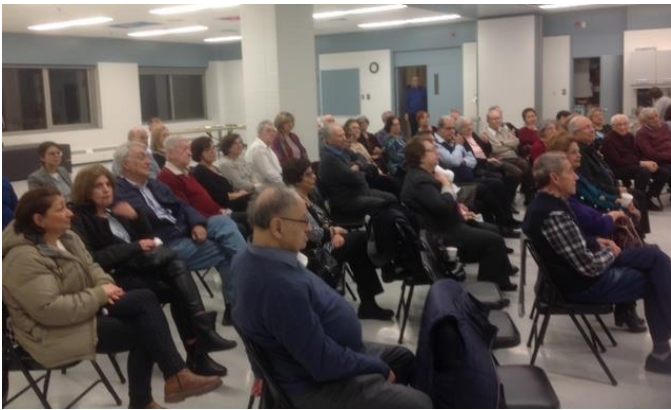
Nos conférences ont toutes été bien écoutées.